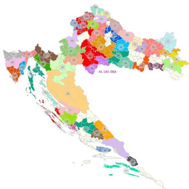
Slika 2: Karta položaja LAG-a na karti Republike Hrvatske